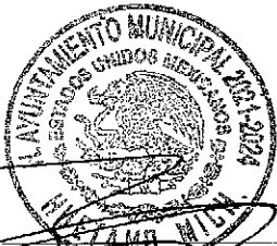
FIG. PABLO VINCENZO ESPADA PRESIDENTE MUNICIPAL